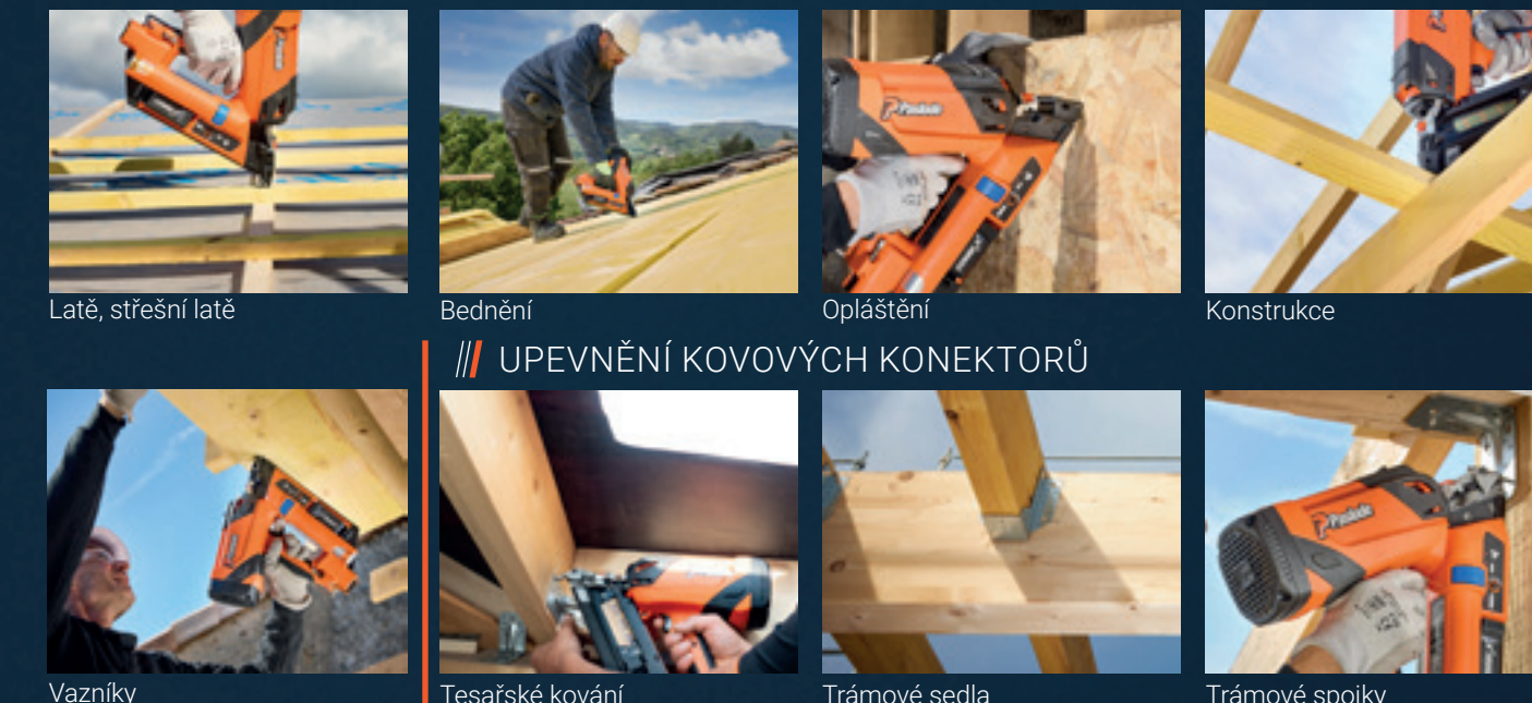
Latě, střešní latě